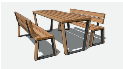
Table et bancs confort

Table : L 200 x l 74 x H 76 cm - Douglas