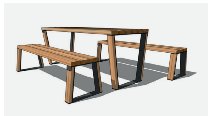
Table et bancs classiques

Table : L 200 x l 74 x H 76 cm - Banc : L 180 x l 48 x H 75 cm - Douglas